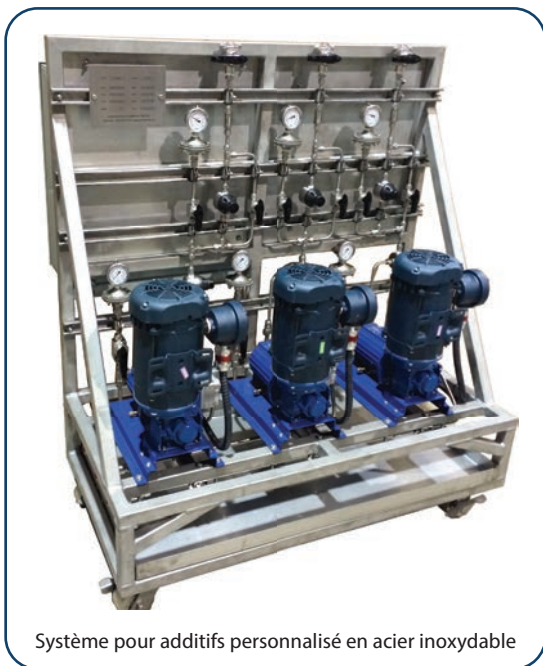
Système pour additifs personnalisé en acier inoxydable

Veuillez composer le 1 877 624-5757 pour communiquer avec un expert en système qui vous guidera selon vos exigences en matière d'utilisation.