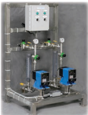
Modèle standard – Acier inoxydable