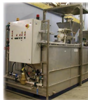
Unité de mise en solution de polymère liquide