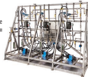
Système de mise en solution de polymère