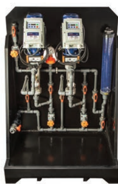
Modèle standard – Pompes à vis excentrée