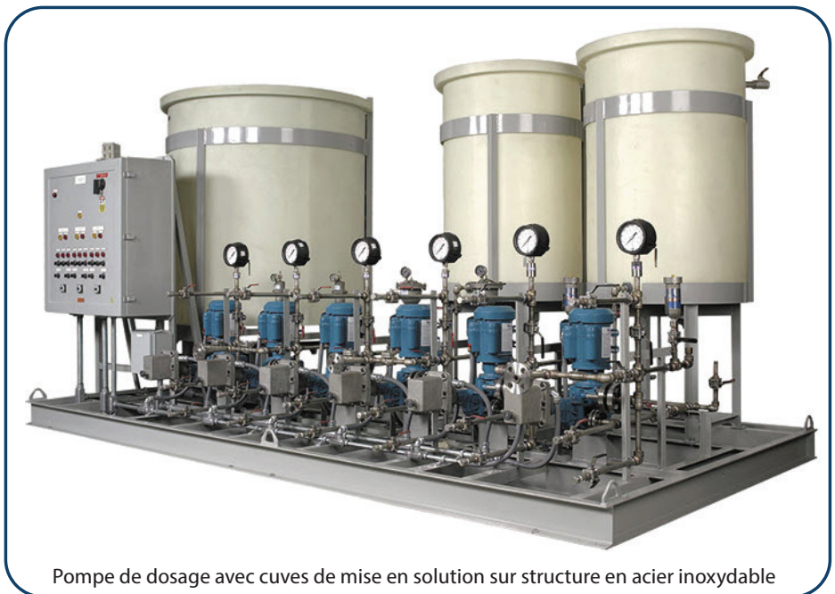
Pompe de dosage avec cuves de mise en solution sur structure en acier inoxydable