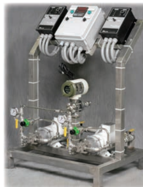
Modèle standard – Pompes à engrenages