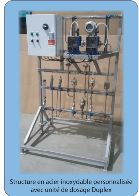
Structure en acier inoxydable personnalisée avec unité de dosage Duplex