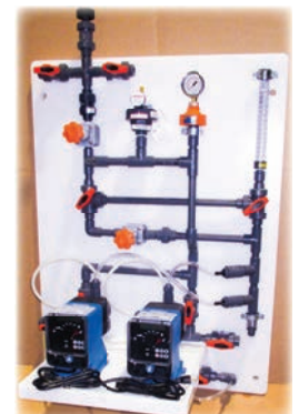
Panneau de dosage d'hypochlorite