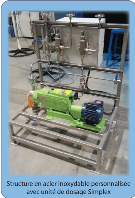
Structure en acier inoxydable personnalisée avec unité de dosage Simplex

Veillez composer le 1 877 624-5757 pour communiquer avec un expert en système qui vous guidera selon vos exigences en matière d'utilisation.