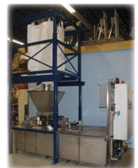
Unité de mise en solution de polymère sec