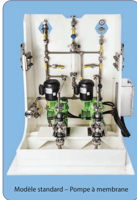
Modèle standard – Pompe à membrane