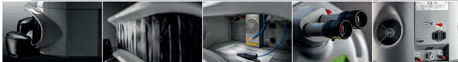
Air/gas inlet Ingressi aria/gas