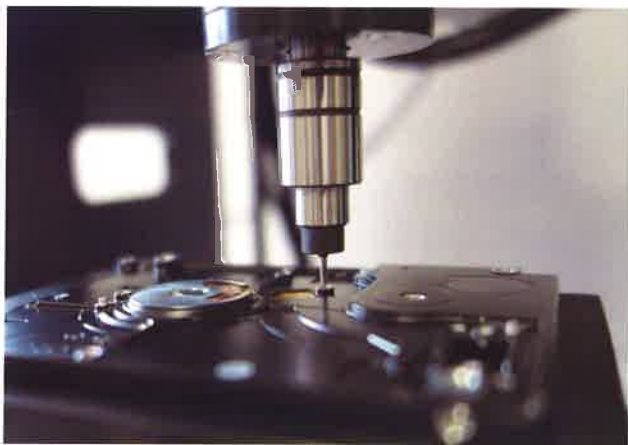
2.5' HDDケース M1.6×0.35 検査例