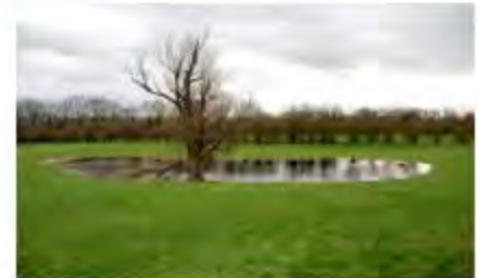
Figuur 4.2 Hoofdindeling landschapselementen.