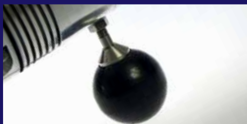
Dispone de mangos extraíbles para ayudar a mantener su herramienta más limpia