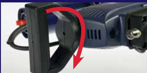
Mango giratorio para una gran ergonomía