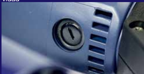
Escobilla de carbón fácil y rápida de cambiar