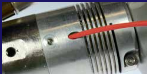
Varillas de soldadura fáciles de insertar a ambos lados para facilitar posturas de soldado más flexibles