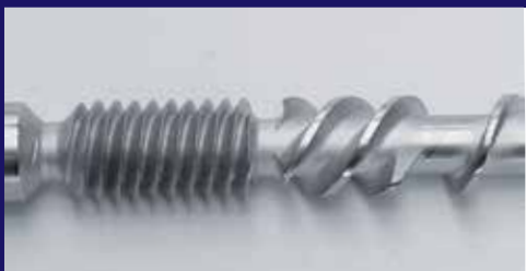
Tornillo de alta calidad para una vida útil más larga