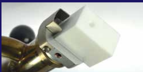
Sustitución rápida de la zapata de soldadura que tiene como resultado una alta productividad