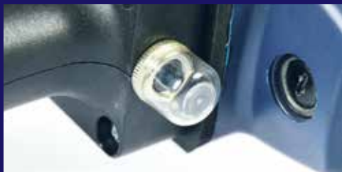
Protección visible contra las sobrecargas para un mayor control