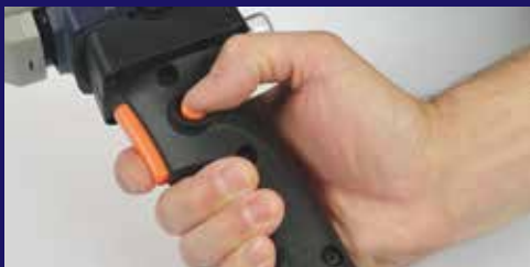
Botones de bloqueo para una soldadura de extrusión continua con poco esfuerzo