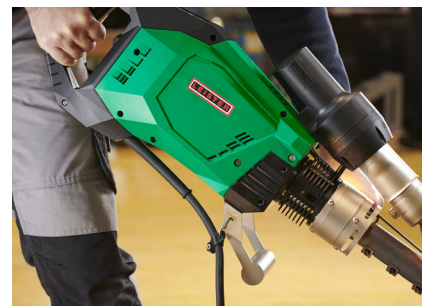
Óptimo tendido de cables