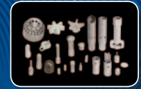
PIEZAS Y SERVICIO

COMBUSTIÓN Y SOLUCIONES AMBIENTALES. PURAS Y SIMPLES.®