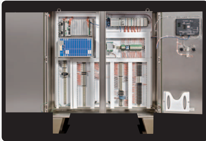
Panel de BMS