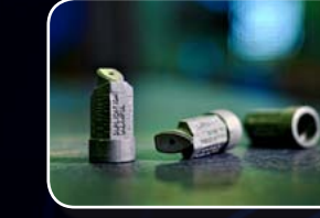
Boquillas de gas