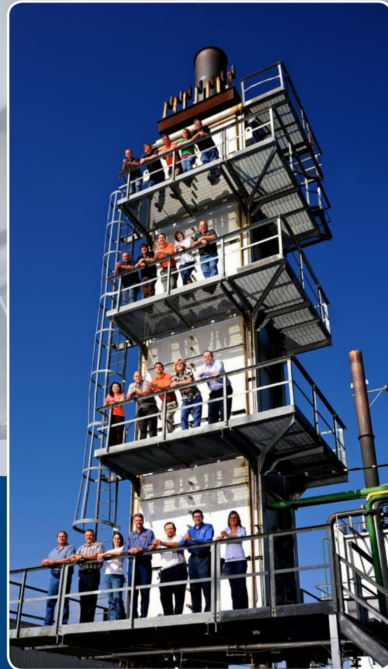
El equipo de productos y servicios pos-venta de Zeeco

Zeeco es el líder mundial en productos de combustión de pos-venta. Ofrecemos componentes de repuesto para nuestros propios equipos superlativos, así como piezas de repuesto de nuestros competidores, todo a precios extremadamente competitivos.