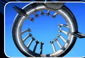
Anillo de vapor superior