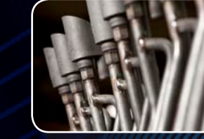
Piezas para antorchas y sistemas de encendido