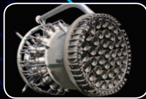
Boquillas de antorcha de reposición