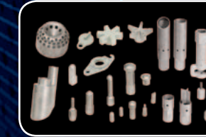
PIEZAS Y SERVICIO

COMBUSTIÓN Y SOLUCIONES AMBIENTALES. PURAS Y SIMPLES.®