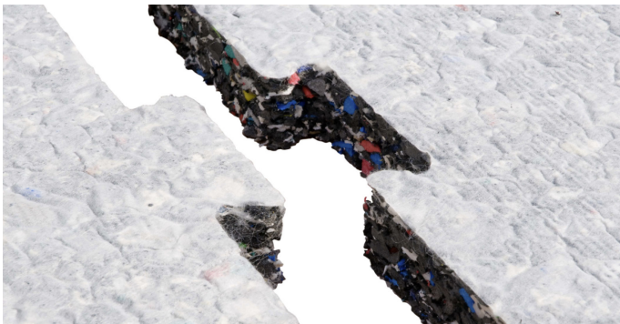
Puzzelförmige ProPlay® Elastikschiicht für Spielplätze