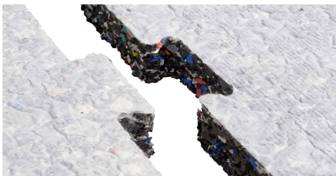
Puzzelförmige ProPlay® Elastikschiicht für Spielplätze