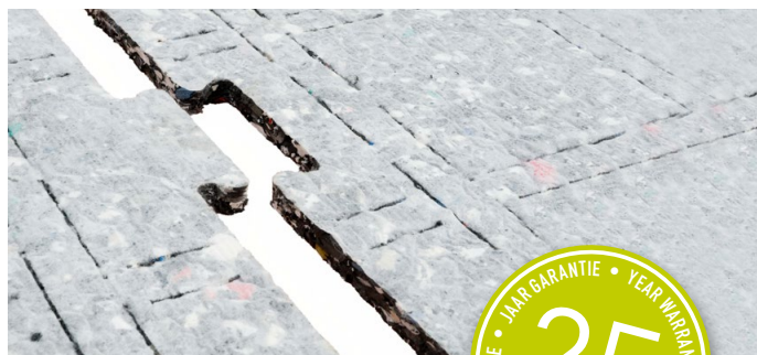
Puzzelvormige ProPlay ® platen met expansiesleuven