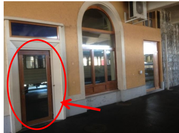
4. Entrer par cette porte