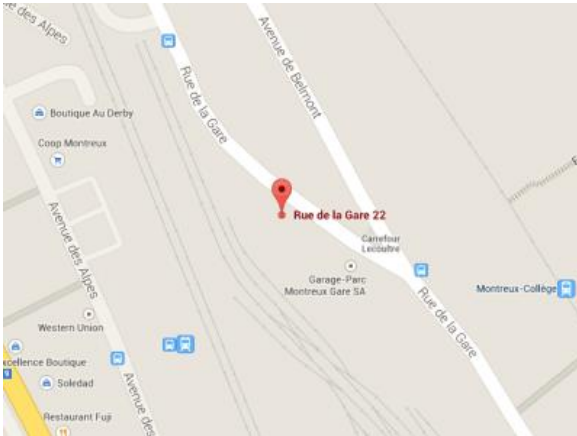
1. Plan de situation

Adresse : MOB-Center, rue de la gare 22, 1820 Montreux Téléphone : Réception : 021/989.81.81, salle -2 : 021/989.81.84 Clef : MOB, service Marketing au 1 er étage