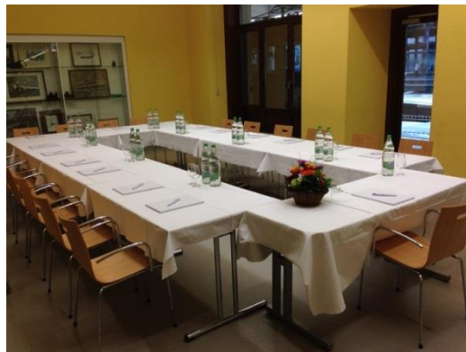
5. Cordiale bienvenue dans la salle -2