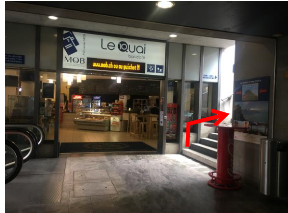
2. Se rendre au fond du passage sous voie