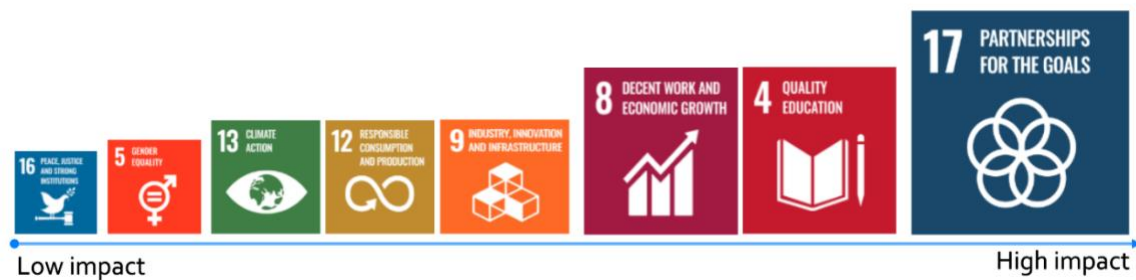
Figur 2: Grad av påvirkning på FNs bærekraftsmål

Visolit har identifisert en signifikant påvirkning for åtte av FNs bærekraftsmål. Partnerskap er fundamental for å sikre en bærekraftig utvikling for områdene vi arbeider med. Det er en integrert del av vår strategi, og er også i tråd med våre kjerneverdier Embrace knowledge, Achieve together og Empower change. Gjennom partnerskap har vi tro på at vi kan bidra til positiv utvikling innen alle områdene for FNs handlingsplan og bærekraftsmål. Illustrasjonen under viser Visolits grad av påvirkning på de utvalgte bærekraftsmålene, basert på de aktiviteter og initiativer vi arbeider med i dag.