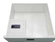
引き出し内 小物収納庫