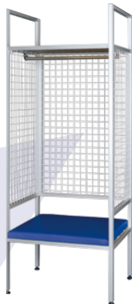
ASPT-2075-ML (1人用・メタリックフレーム)

本体：ハンガーパイプ、アジャスター、座面マット(色：ブルー/レッド)付 側背面：ワイヤー加工 (※組立式)