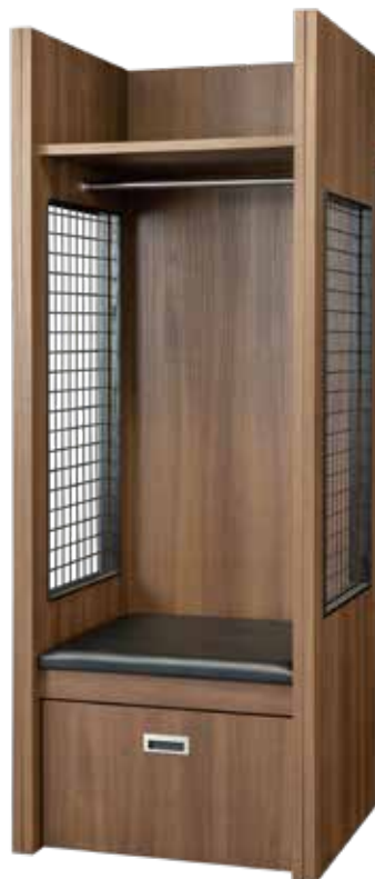
スタジアムロッカー