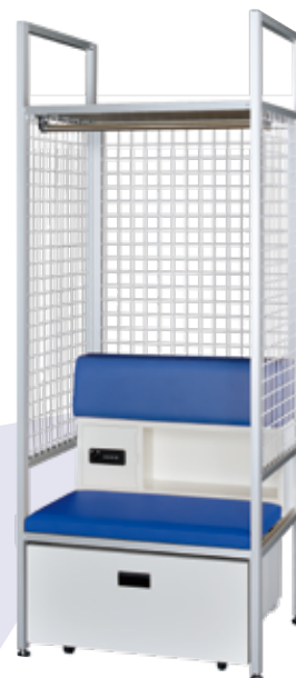
ASPT-2075-KSH-ML (1人用・メタリックフレーム)

本体：ハンガーパイプ、アジャスター、座面マット(色：ブルー/レッド)付 側背面：ワイヤー加工 背面：背もたれ・小物収納付 下部：引出し収納付 (※組立式)