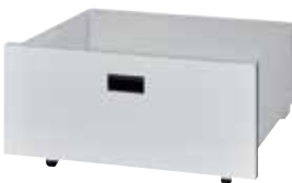
HD-360 (引き出し) H360×W705×D630 キャスター付