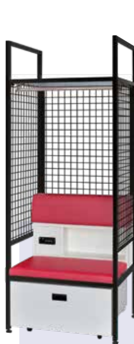
ASPT-2075-KSH-BK (1人用・ブラックフレーム)

小物収納付背もたれ・引出しを付属したフルオプションタイプです。 大容量な収納スペースと鍵付小物収納で、 多種多様な手荷物を使い勝手よくご利用いただけます。