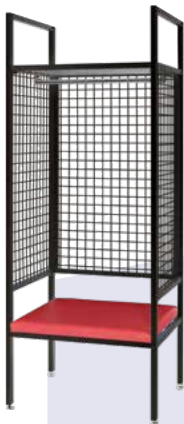
ASPT-2075-BK (1人用・ブラックフレーム) H2000×W775×D650

本体：ハンガーパイプ、アジャスター、座面マット(色：ブルー/レッド)付 側背面：ワイヤー加工 (※組立式)