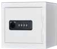
CZ1-1 (小物収納庫) H250×W250×D250 ゼロリセット錠