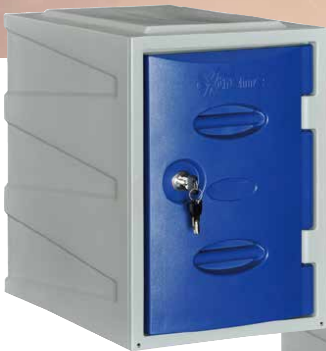
PLA-01 (1人用) H450×W320×D460 耐衝撃性ポリエチレン製・一体成型