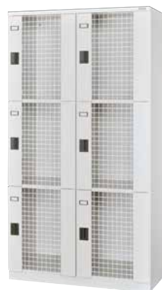
S2-3MH (2列3段 6人用)

丁番：掛け丁番 横中仕切板溶接固定(補強付)、底板(補強付)、 プラスチック名札差 付