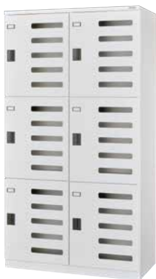
S2-3 (2列3段 6人用)