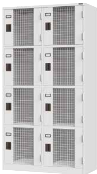
S2-4MH (2列4段 8人用)

丁番：ピンヒンジ 横中仕切板溶接固定(補強付)、底板(補強付) 扉(補強付)気孔抜き加工、 プラスチック名札差 付