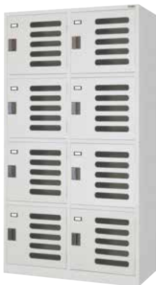
S2-4 (2列4段 8人用)

武道用具保管を想定し、通気性を高めた多収納を目的としたロッカー 用具・衣類の清潔感を重要視して、通気性が良く広いロッカーを提供します。