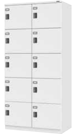
スチールロッカー(2列5段10人用)

H1900×W900×D510 横中仕切板溶接固定、扉(補強付)、プラスチック名札差