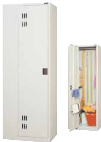
クリンボックス CL-04 H1790×W650×D450 扉(補強付)、棚板、ハンガーパイプ、Sフック[7]、タオル掛[2]、フック[1]