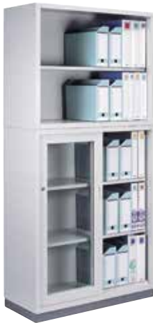
組合せ書庫(W880) 《上》KR-320N オープン書庫 1 列 2 段 《下》KR-345A 引き違い書庫 1 列 3 段 《ベース》KR-312-B W880 用ベース 上 : H730×W880×D400 棚板[1] 付 下 : H1060×W880×D400 ガラス引戸・棚板[2] 付 ベース : H60×W880×D385