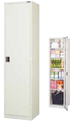
ストックケース SL-61 H1790×W455×D410 扉(補強付)、自在棚 [5]