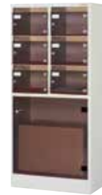
バゲージ収納ボックス(2列3段6区分用)

H1600×W829.5×D360 (上/h186×w252.5、下/h516×w793.5) 上扉/アクリル3mm(シリンダー錠付) 下扉/アクリル5mm、底板(補強付)