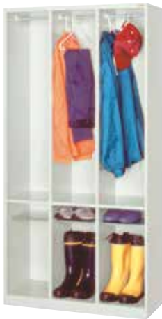
更衣 & ブーツロッカー(3連3人用) NB31N H1790×W900×D515(h1122/552×w276) 中棚、ハンガーパイプ、Sフック[3]