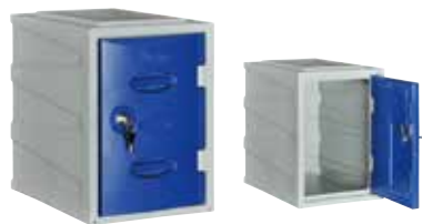
プラスチックロッカー

H1295×W1194×D410(h387×w374) 横中仕切板溶接固定、扉(補強付)、名札差プレス加工