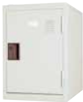
パーソナルロッカー

個人の所有物などの収納に適したパーソナルロッカー。 スペースに合わせて組み合わせられるタイプや、 衝撃に強く、丸ごと水洗いできるプラスチックロッカーなどご用意しました。