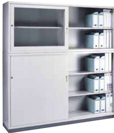
組合せ書庫(W1760) 《上》KR-625A 引き違い書庫 2 列 2 段 《下》KR-645H 引き違い書庫 2 列 3 段 《ベース》KR-612-B W1760 用ベース 上 : H730×W1760×D400 ガラス引戸・棚板[2] 付 下 : H1060×W1760×D400 スチール引戸・棚板[4] 付 ベース : H60×W1760×D385