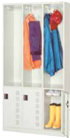
更衣 & ブーツロッカー(3連3人用) NB31-2 H1790×W900×D515(h1122/552×w276) 扉(補強付)、中棚、ハンガーパイプ、Sフック[3]