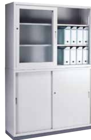
組合せ書庫(W1200) 《上》KR-435A 引き違い書庫 1 列 3 段 《下》KR-435H 引き違い書庫 1 列 3 段 《ベース》KR-412-B W1200 用ベース 上 : H880×W1200×D400 ガラス引戸・棚板[2] 付 下 : H880×W1200×D400 スチール引戸・棚板[2] 付 ベース : H60×W1200×D385