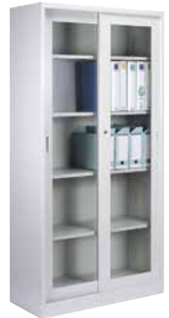
引き違い書庫 1 列 5 段 KR-365A H1790×W880×D400 ガラス引戸・棚板[4] 付