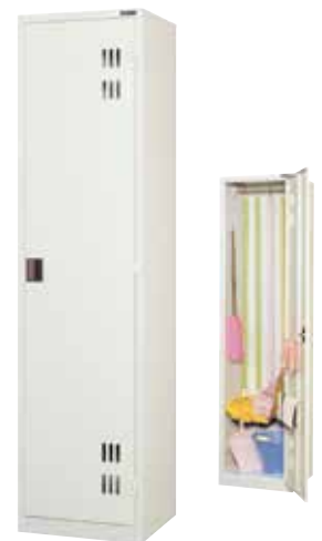
クリンボックス CL-02 H1790×W455×D410 扉(補強付)、ハンガーパイプ、Sフック[5]、タオル掛[2]、フック[2]