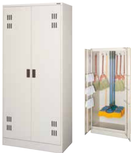
モップ収納ボックス CL-08 H1790×W800×D450 扉(補強付)、ハンガーパイプ、Sフック[8]、タオル掛[6]、フック[10]