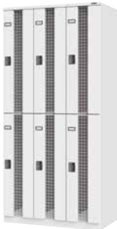
ワイヤーメッシュロッカー(3列2段6人用)