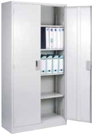
両開き書庫 1 列 5 段 KR-360T H1790×W880×D380 棚板[4] 付

署内のオフィススペースで必要な整理用戸棚です。 多種多様な保管物を収納するために各種取り揃えました。