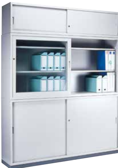
組合せ書庫(W1760) 《上》KR-615H 引き違い書庫 《中》KR-635A 引き違い書庫 2 列 3 段 《下》KR-635H 引き違い書庫 2 列 3 段 《ベース》KR-612-B W1760 用ベース 上 : H400×W1760×D380 スチール引戸 付 中 : H880×W1760×D400 ガラス引戸・棚板[4] 付 下 : H880×W1760×D400 スチール引戸・棚板[4] 付 ベース : H60×W1760×D385