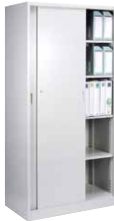
引き違い書庫 1 列 5 段 KR-365H H1790×W880×D515 スチール引戸・棚板[4] 付