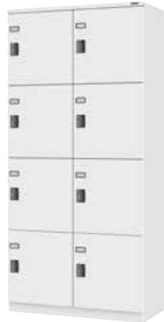
スチールロッカー(2列4段8人用)

H1900×W900×D510 横中仕切板溶接固定、扉(補強付)、中棚、Sフック[3]、フック、ハンガーパイプ、プラスチック名札差