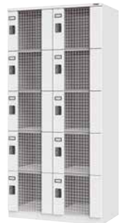
ワイヤーメッシュロッカー(2列5段10人用)