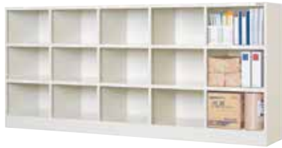
書類保管ケース(5列3段15口用)

H900×W1578×D350(h184×w762) 天板(補強付)、横中仕切板溶接固定(補強付)、底板(補強付)