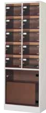
バゲージ収納ボックス(2列5段10区分用)