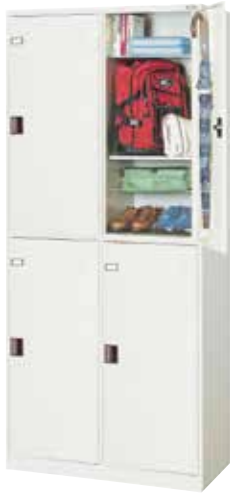
更衣ロッカー(2列2段4人用) LE2-2 H2000×W900×D410(h942×w423) 扉(補強付)、プラスチック名札差、中棚[3]、 傘受、ツユ受、アジャスター