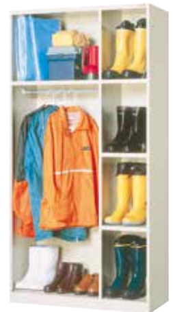
更衣 & ブーツロッカー(多人数用) HY-4N H1790×W900×D410 (左/ h409.5/1264.5×w570、右/ h409.5×w276) ハンガーパイプ、Sフック[4]