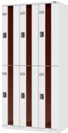
ポリカーボネートロッカー(3列2段6人用)

H1900×W900×D510 横中仕切板溶接固定、扉(補強付)、プラスチック名札差