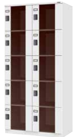
ポリカーボネートロッカー(2列5段10人用)