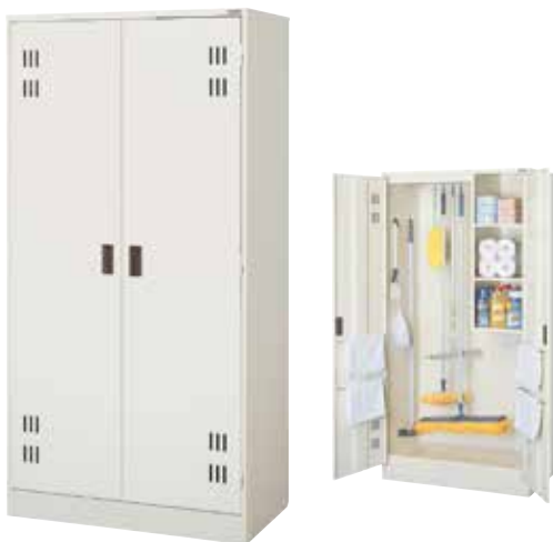
両開きクリンボックス CL-21 H1790×W900×D510 扉(補強付)、棚3段、ハンガーパイプ、Sフック[8]、タオル掛[4]、フック[4]