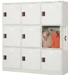
個人用品ロッカー(3列3段9人用)

H450×W312×D450(h387×w276) 扉(補強付)、名札差プレス加工、連結穴、中棚、天板スベリ止め ※スペースに合わせた上下・左右連結可能製品