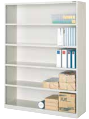
書類保管ケース(5段5口用)

H900×W2000×D450(h240.6×w378.4) 天板(補強付)、横仕切板差込構造(補強付)、底板(補強付)、各部溶接補強、巾木一体