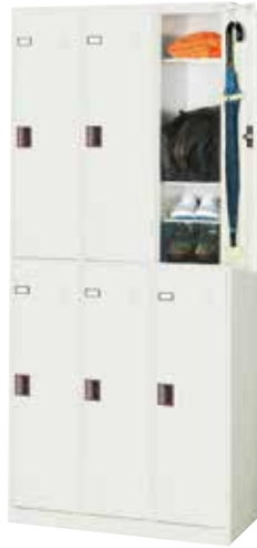
更衣ロッカー(3列2段6人用) LD3-2 H2000×W900×D410(h942×w276) 扉(補強付)、プラスチック名札差、中棚[3]、 傘受、ツユ受、アジャスター