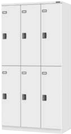
スチールロッカー(3列2段6人用)

通常のスチール扉やポリカーボネート扉・ワイヤーメッシュ扉と、設置場所・用途によりお選びください。