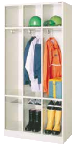
更衣 & ブーツロッカー(3連3人用) NA31N H1900×W900×D515(h302/945/475×w276) クロームメッキ網棚、ハンガーパイプ、Sフック[3]、中棚 名札差プレス加工