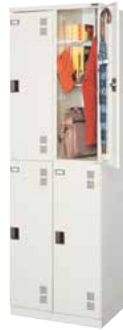
更衣ロッカー(2列2段4人用) CHL2-2 H1790×W600×D515(h843×w292) 扉(補強付)、プラスチック名札差、中棚[2]、ハンガーパイプ、 Sフック[3]、フック[2]、傘受、ツユ受