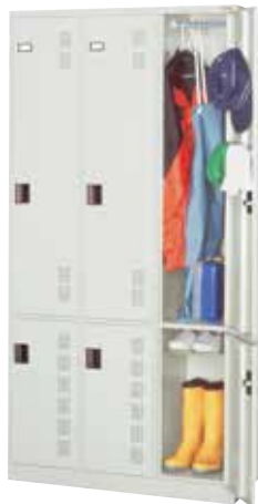
更衣 & ブーツロッカー(3連3人用) NB31-12 H1790×W900×D515(h1122/552×w276) 扉(補強付)、プラスチック名札差、中棚、ハンガーパイプ、 Sフック[3]、タオル掛、フック