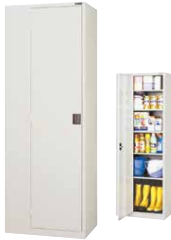
ストックケース SL-63 H1790×W650×D450 扉(補強付)、自在棚(補強付) [5]