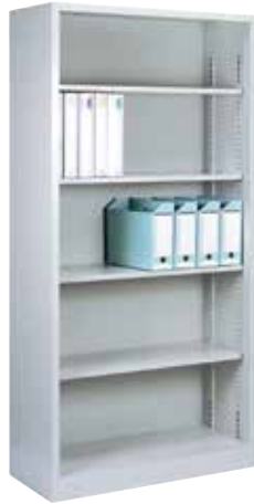
オープン書庫 1 列 5 段 KR-360N H1790×W880×D400 棚板[4] 付