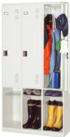
更衣 & ブーツロッカー(3連3人用) NB31-1 H1790×W900×D515(h1122/552×w276) 扉(補強付)、プラスチック名札差、中棚、ハンガーパイプ、 Sフック[3]、タオル掛、フック