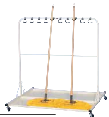
モップスタンド 070-010 H1200×W1150×D1010 キャスター/ストッパー付[2]、なし[2]

キャスターで移動ができるので収納場所からの持ち出しや後かたづけが一人でも楽にできます。