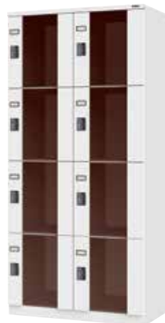
ポリカーボネートロッカー(2列4段8人用)

H1900×W900×D510 横中仕切板溶接固定、中棚、Sフック[3]、フック、ハンガーパイプ、プラスチック名札差