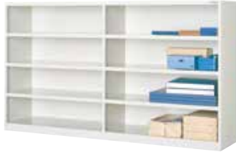
書類保管ケース(2列4段8口用)

書類や備品などの収納用に使用する書類保管ケース。 堅牢な仕様で、多くの荷物を収容できます。