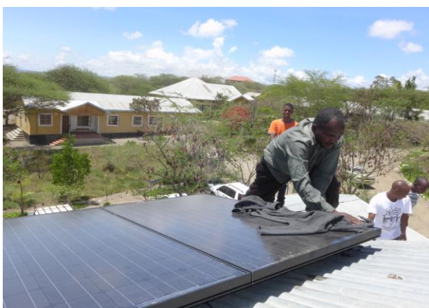
Klimafondet: Installasjon av solcellepaneler på en skole i Nord-Tanzania.

Klimafondet brukes til å finansiere fornybare energiprojekter i utviklingsland. Ved salg av vannkraft betaler leverandøren en donasjon til Miljøfondet , som blir brukt til å finansiere elverestaureringsprosjekter.