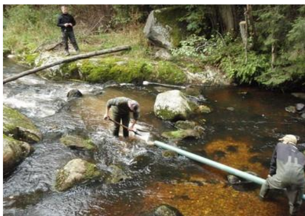
Miljøfondet: Frivillige som hjelper til på et elverestaureringsprosjekt i Finland.

Foretrekker du at «bidragene» går til et spesifikt prosjekt? EKOenergi kan støtte klima- og elverestaureringsprosjekter gjennom samarbeid med strømleverandører.