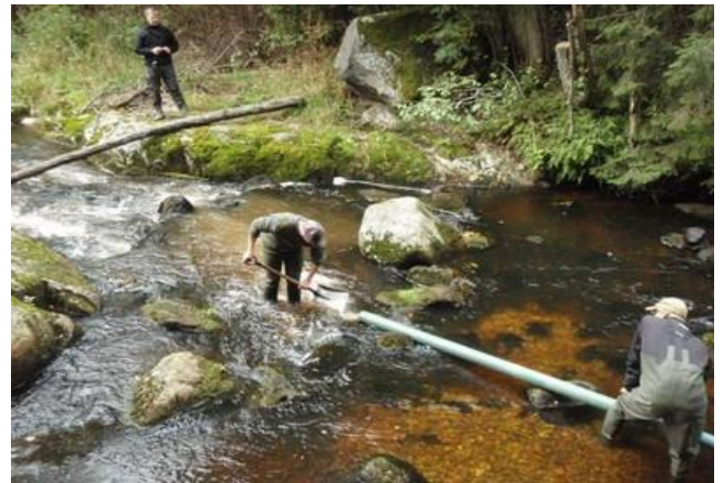
Fonds pour l'environnement: des volontaires aidant à la restauration d'une rivière en Finlande.

Vous souhaitez que votre contribution aille à un projet spécifique? EKOénergie peut soutenir des projets directement en coopération avec votre entreprise.