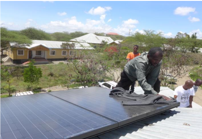
Fondo per il Clima: installazione di pannelli solari in una scuola in Tanzania

Il Fondo per il Clima finanzia progetti riguardanti le energie rinnovabili nei Paesi in via di sviluppo. Se l'energia acquistata è energia idroelettrica, il fornitore versa un contributo al Fondo per l'Ambiente ; il fondo viene utilizzato per promuovere progetti di riqualificazione fluviale.